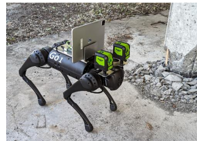
四足歩行ロボット

参加者様に、四足歩行ロボットの基本的な操縦及びAR技術を用いた遠隔臨場について実際に体験して頂きます。