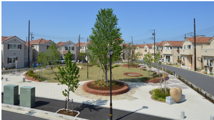
自然監視性の高い公園