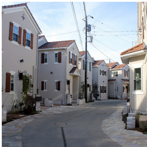
領域性の高い クルドサック