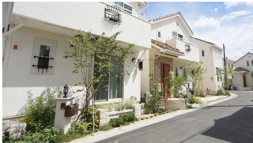
見通しの良い オープン外構