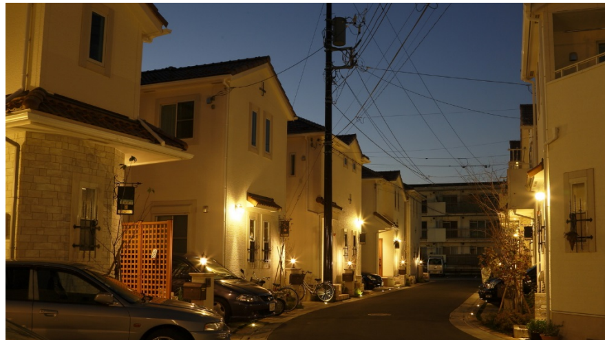
灯かりのいえなみ協定(LED外灯の全戸点灯)