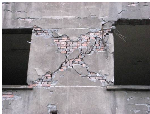
写真8 組積造による非構造壁のせん断破壊 (都江堰)