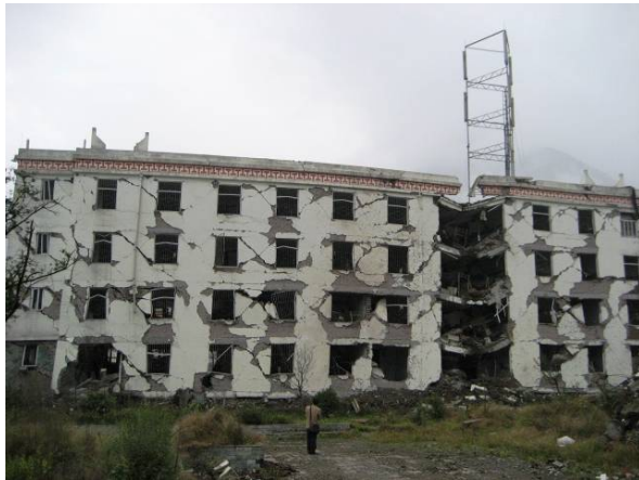
写真1 1階が完全に崩壊した5階建ての 学生寮（映秀）