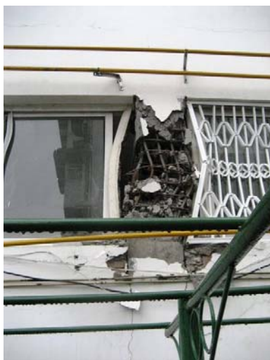
写真5 短柱のせん断破壊（都江堰）

この破壊を防止するために、日本では耐震スリットを設ける方法やせん断補強筋を多く配して柱のせん断耐力を向上させる方法が一般的であり、また、耐震補強としては鋼板や炭素繊維シートによるせん断補強など様々な方法が開発されている。このような技術の移転は被害の軽減に有効であろう。