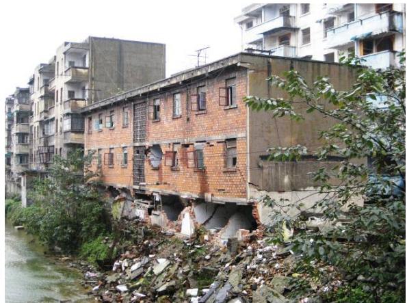
写真2 1階が大きく破壊された組積造（漢旺）