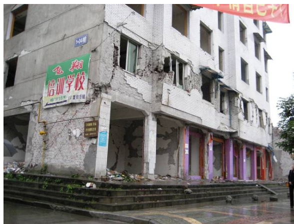
写真4 2階に被害が集中した建築物（都江堰）