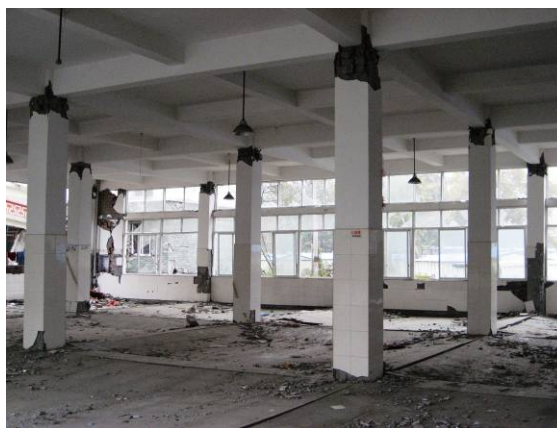
写真6 柱頭・柱脚の曲げ破壊（映秀）