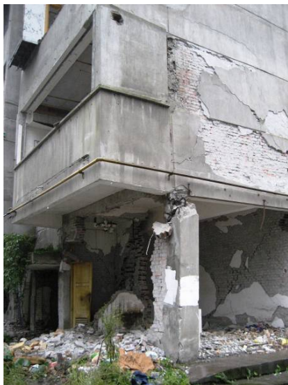
写真3 下階壁抜け部分で大きく 損傷した1階の柱（都江堰）