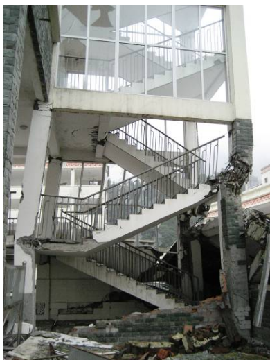
写真7 階段が取り付く柱の破壊 (映秀)

写真8は、組積造の壁のせん断破壊であるが、このような破壊は比較的小さな変形で生じやすい。しかしながら、この破壊が生じたとしても柱やはりなどの構造部材が健全であれば、建築物の耐震性能はほとんど低下していないと考えられることから、脱落の危険性を除けばこのような被害は一般には許容されよう。ただし、地震以降の建築物の機能性が求められる場合には、非構造部材の損傷も適切に制御していく必要があるが、そのための設計方法については、日本でも研究途中の課題である。